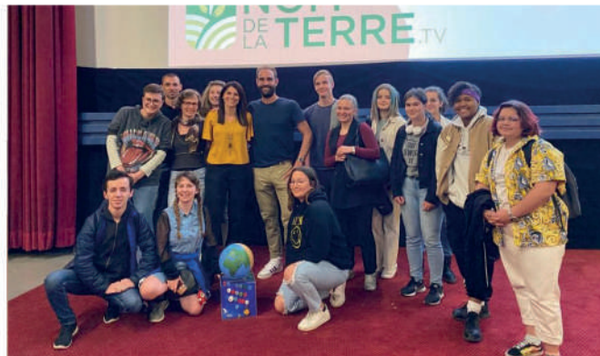
Lycée agricole de Cibeins vainqueur du Trophée On Peut Mieux Faire 2022