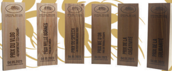
Les trophées 2023